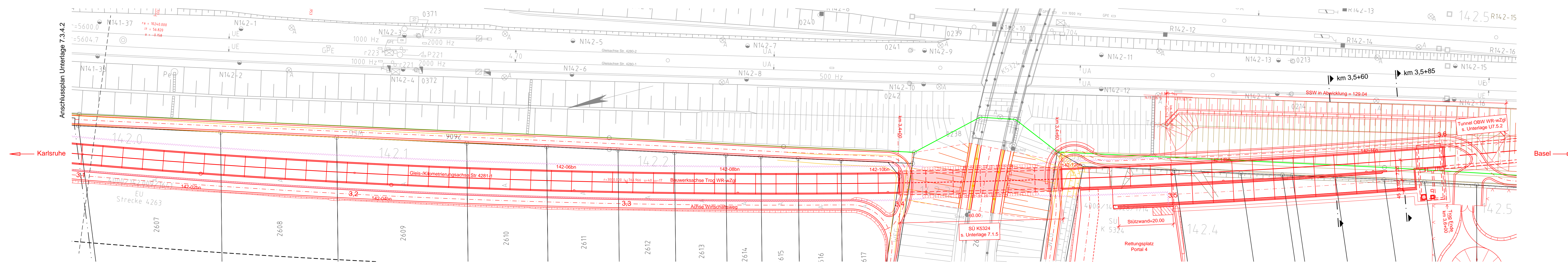
Draufsicht M 1:500