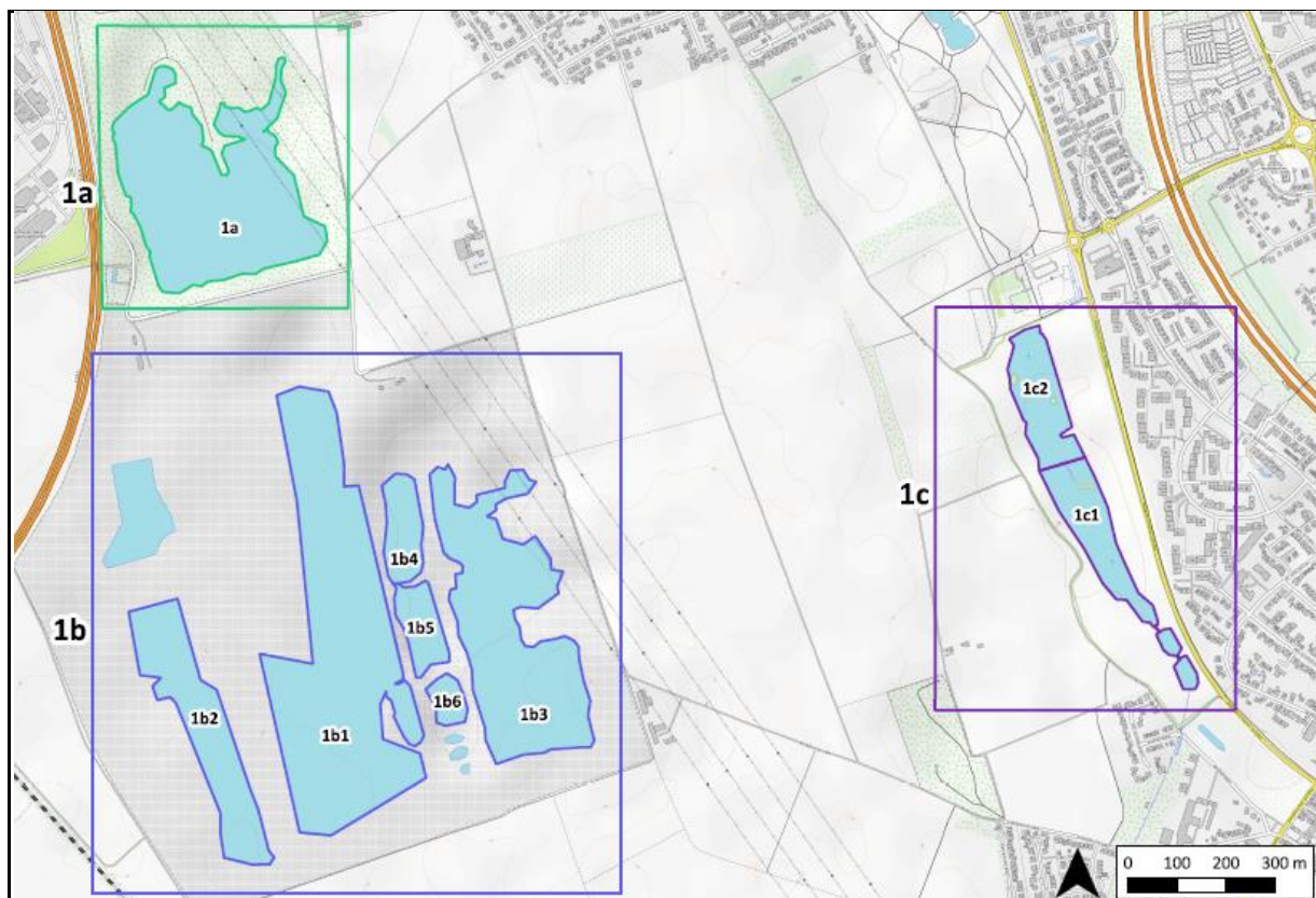
Abbildung 1: Lage der Gewässer bei Brühl

Die konkrete Lage und die Unterteilung in einzelne Gewässer bzw. Zählbereiche sind der Abbildung 1 und der Abbildung 2 zu entnehmen.